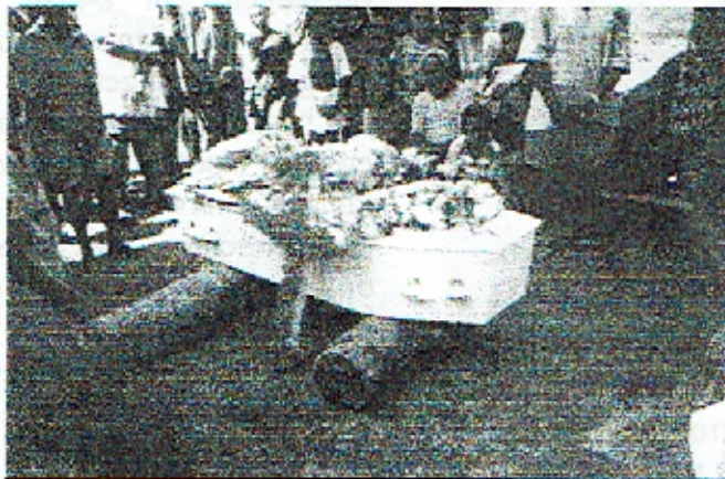
Mensen verzamelen voor de begrafenis in Buin