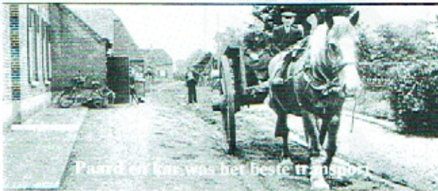
Paard en kar was het beste transport

Destijds, in 1935 zag alles er nog heel anders uit in Wanroy. Een gemeenschap van hard werkende boeren met nog een eigen gemeentehuis en een eigen burgemeester. Het was er vroeg dag en men ging met de kippen op stok. Het meeste werk op het land werd nog met de hand gedaan of met het paard. Toch was de eerste trekker al aan het werk in Wanroy. De wegen waren nog niet verhard en een enkeling had al een fiets.