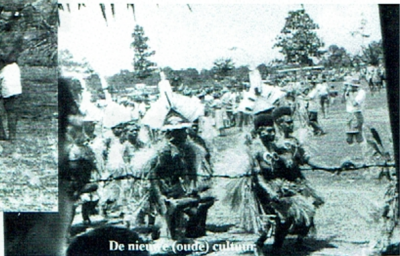
De nieuwe (oude) cultuur