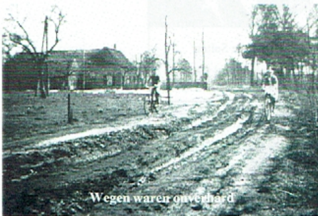
Wegen waren onverhard