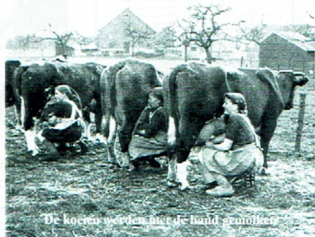
De koeien werden met de hand gemolken