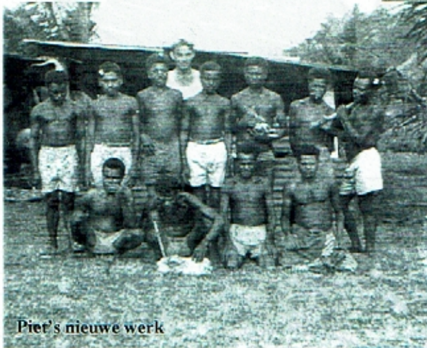
Piet's nieuwe werk