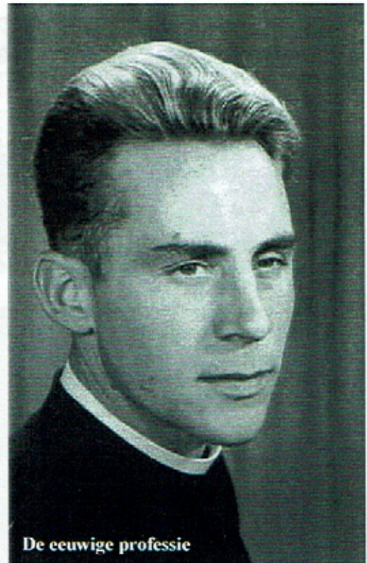
De eeuwige professie