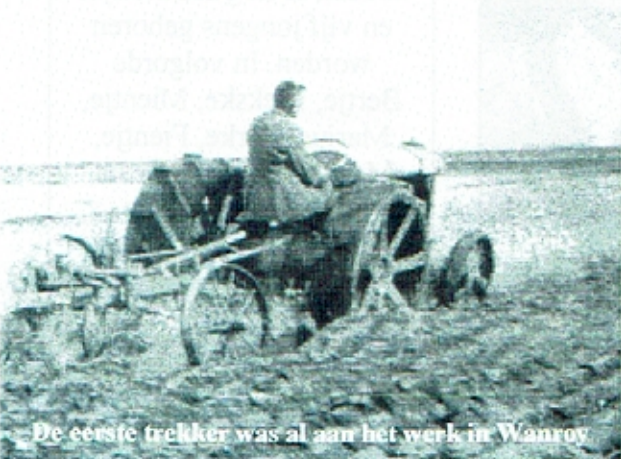
De eerste trekker was al aan het werk in Wanroy

s'Morgens in alle vroegte togen de vaders met hun zonen naar land en stal. Moeder de vrouw ging met de dochters de koeien melken, de kalveren voeren en de eieren uit de nesten halen. Dag in dag uit moest er hard gewerkt worden om brood op de plank te hebben. Ook schoolkinderen werden na schooltijd ingezet bij allerlei werkzaamheden.