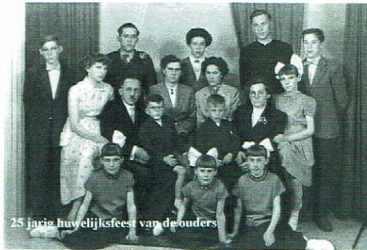
25 jarig huwelijksfeest van de ouders