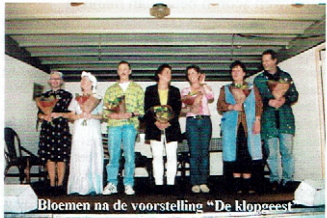
Bloemen na de voorstelling "De klopgeest"

"Minoes" hebben we in omringende dorpen in gemeenschapshuizen en scholen e.d. gespeeld waarna we onze "eigenlijke" voorstelling in zaal "Het Dorstige Hert" in Escharen speelden. Bij dit rondtrekken door de dorpen kwam het mobiele decor goed van pas. Dat hebben we in 3 weekenden 4 keer opgebouwd en afgebroken voor vijf uitvoeringen. In sommige gevallen moest er eerst nog een podium gebouwd worden en zo is het een keer voor gekomen dat we voor 1 uur optreden een hele dag met z'n allen aan het sjouwen zijn geweest.