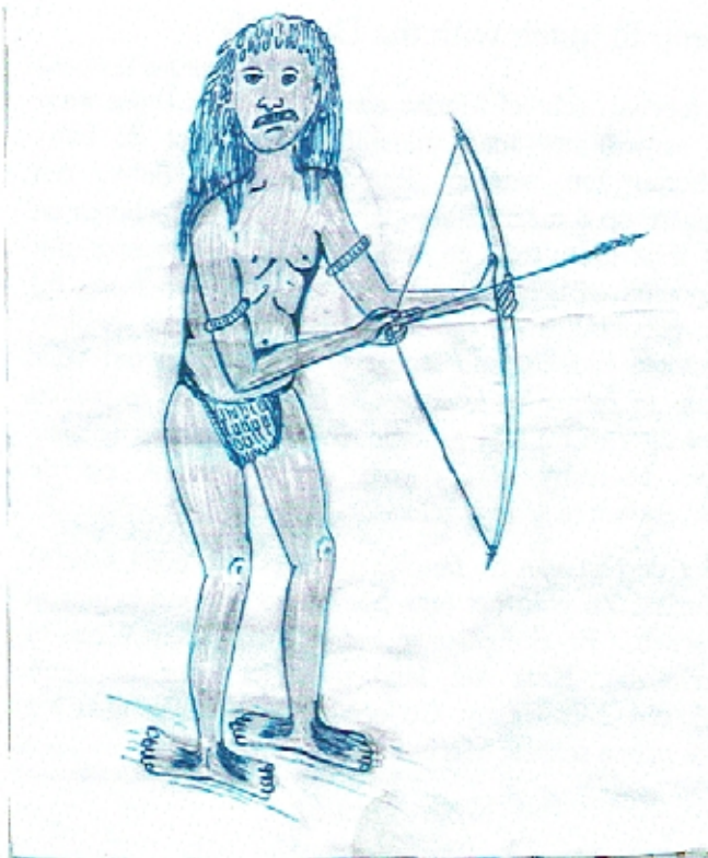
Spirit Ghost Komarara / Komakiki

Als er inderdaad een boom op haar graf gaat groeien proeven de broeders alle delen. De takken, de bladeren en de bloemen maar het smaakt allemaal niet. Tot de boom vruchten gaat dragen die wel lekker smaken. Nu vragen ze zich af hoe ze die vruchten zullen noemen. Om te weten hoe de dieren er op reageren leggen ze een vrucht op een wildpad en verstoppen zich in de buurt. Er komen verschillende dieren voorbij. Een haan noemt het een Pakyrio. Dan komt er een hond voorbij die zegt, "wie geeft mij nou een Muo (kokosnoot) zonder die te pellen. Als ie geschild was zou ik hem over een grote steen schuren en Ariri (bananen pudding) maken en olie om mijn