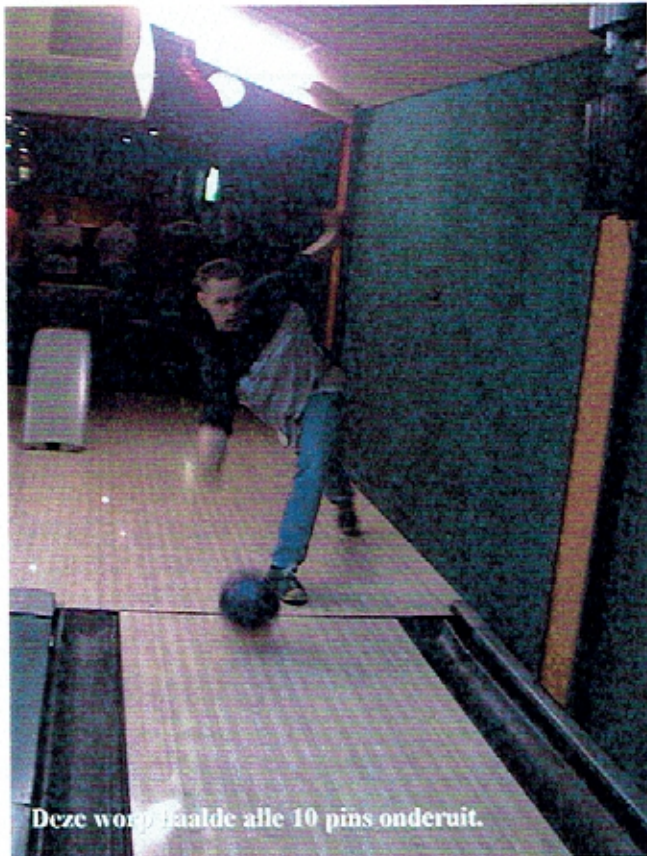
Deze worp haalde alle 10 pins onderuit.

Bowlen is een bezigheid die door de meeste mensen wordt gezien als een recreatieve bezigheid.